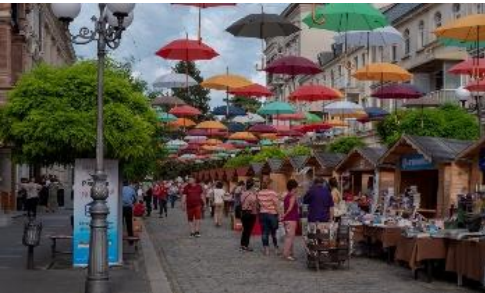
Brăila –un județ pentru fiecare

Luând exemplul altor destinații turistice românești (Sibiu, Sighișoara, Bran, Brașov), Brăila ar putea amenaja un spațiu pentru producătorii locali în piețe volante sau în apropierea unor obiective turistice de interes major. În afara valorificării produselor culinare și artisanale tradiționale, autentice, aceste spații pot contribui la promovarea turismului brăilean. În afara produselor de la târgurile de Crăciun sau de flori din Grădina Mare, pot fi comercializate produse artisanale sau culinare ale diferitelor etnii reprezentate în Brăila în cadrul unor evenimente de celebrare a comunităților reprezentative (greci, turci, evrei etc.)